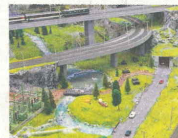
Blick auf EW, Fluss und Zug.

Häusern und Tunnels. Zu «Wunder-World» gehört ein Selbstbedienungsrestaurant, das einem