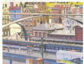
Hauptbahnhof und Stadt.