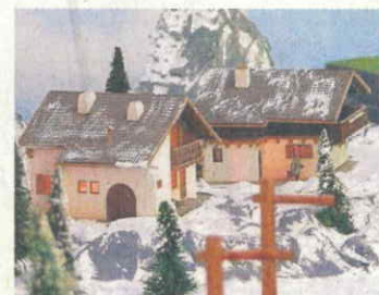
Winterstimmung in den Bergen.